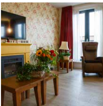
Afbeelding links: woonkamer Kleinschalig Wonen

Bent u mantelzorgers en wilt u ook iets extra's betekenen? Maak dit kenbaar bij de teamleider van de afdeling. Alle hulp is welkom en wordt zeer gewaardeerd.