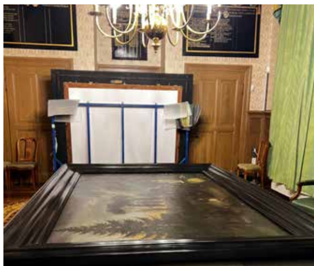
Afbeelding bovenstaand: schilderij ligt klaar voor restauratie

Verhuisbedrijf Pot heeft daarom geholpen om deze van de wand op de tafel in de Regentenkamer te krijgen. Zo kon de restaurateur haar werk goed doen. Het resultaat is vier schilderijen die weer 'shinen' aan de muur. De twee schilderijen uit de Regentenkamer zijn op dezelfde plek teruggehangen. De andere twee hebben een mooie nieuwe plek gekregen in de hal, naast de Regentenkamer.