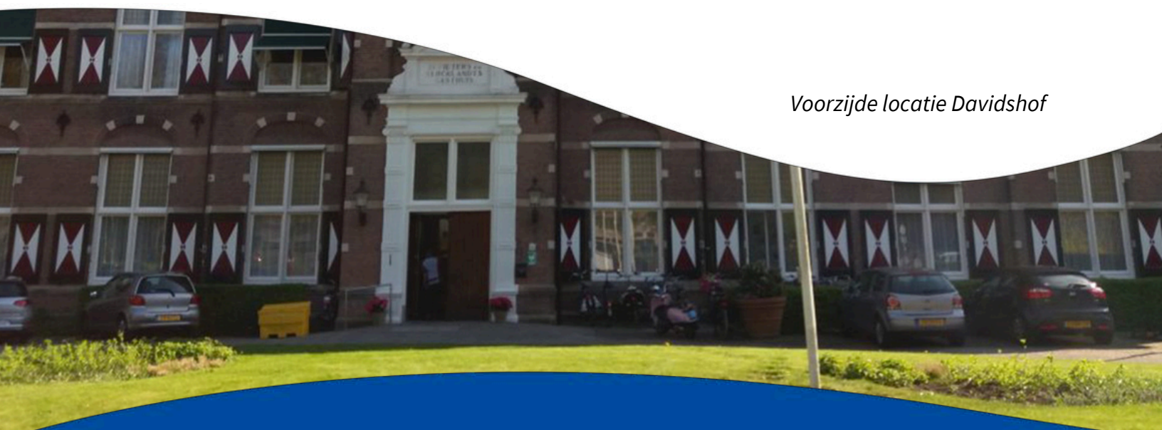
Voorzijde locatie Davidshof