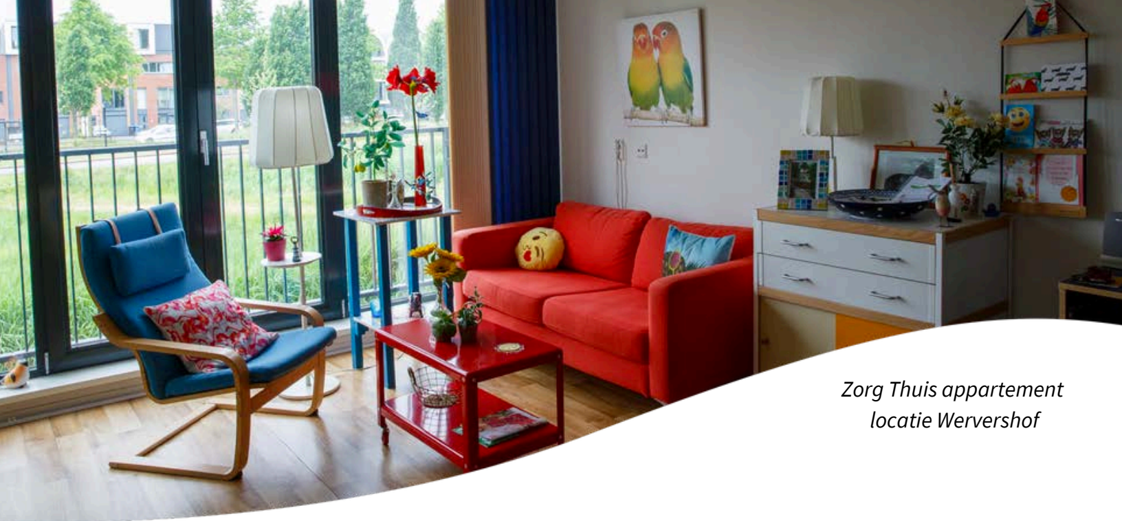
Zorg Thuis appartement locatie Wervershof