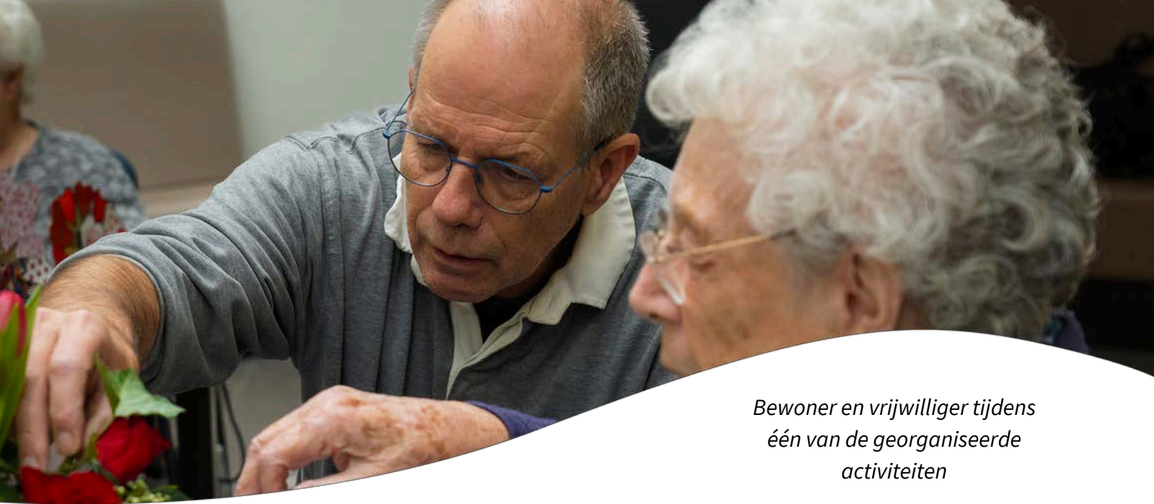
Bewoner en vrijwilliger tijdens één van de georganiseerde activiteiten