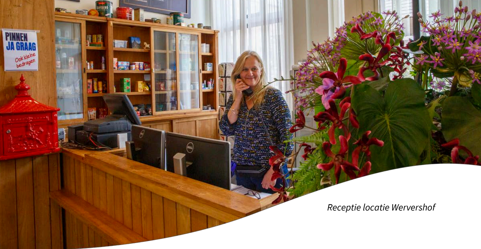
Receptie locatie Wervershof